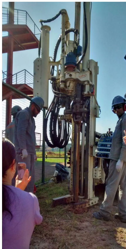
Laboratório de Hidrologia