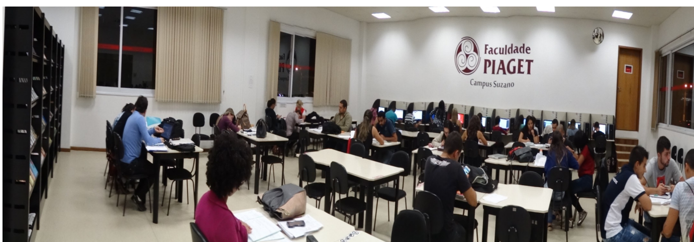
Biblioteca da Piaget: Maior número de consultas e também satisfação com ampliação do horário

Em 2016, por meio eletrônico, o público interno respondeu a diversas questões sobre a faculdade. Os principais resultados estão detalhados nesta edição!